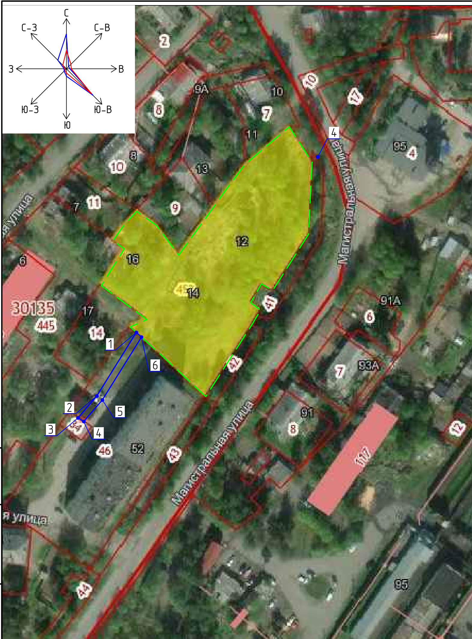
Ситуационный план М 1:10 000